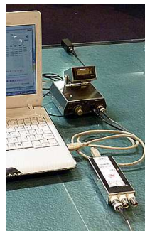
CN1001 + USB ユニット